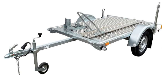
Motorradanhänger VARIO C ungebremst mit 1 Stk. Vorderradwippe, 1 Stk. Aluschiene, Bügel, Fallstützen und Auffahrtsrampe

INFO: Alle Beispielbilder mit Zubehör. Das Zubehör ist nicht im Preis enthalten.