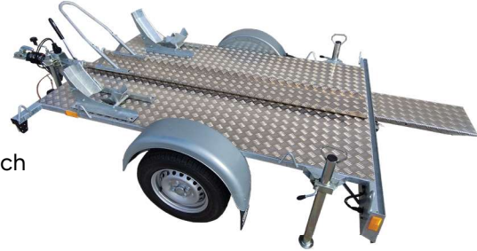
Motorradanhänger CB gebremst mit 2 Stk. Vorderradwippen, 1 Stk. Aluschiene mit Bügel, Fallstützen und Auffahrtsrampe