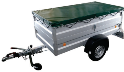
GW 210 G-AP