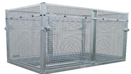
Gitteraufsatzgarnitur nur für Geschweißte Ausführung siehe Seite 36