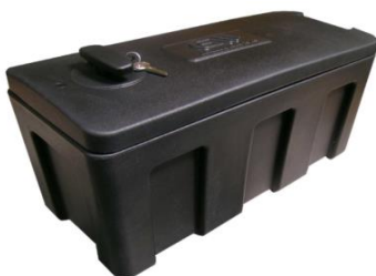
Werkzeugbox mit Montageteile für Deichsel Seite 36