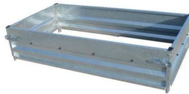
Aufsatzwandgarnitur 400 mm hoch geeignet für Geschweißte Ausführung siehe Seite 34