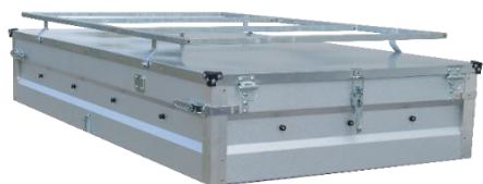
Reling - NEU! für Stahl- und Aludeckel, geeignet für die Leichte, Verstärkte und Geschweißte Ausführung, max. 70 kg belastbar bzw. für Modell WE 125cm Ladeflächenbreite