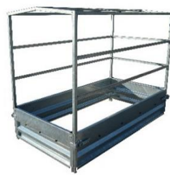
Hochplanenspiegel geeignet für geschweißte Ausführung siehe Seite 35