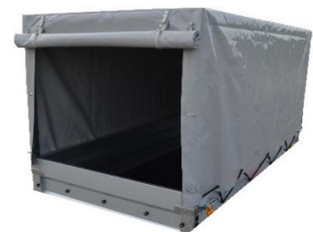
Hochplane montiert bei Leichter oder Verstärker Ausführung siehe Seite 35