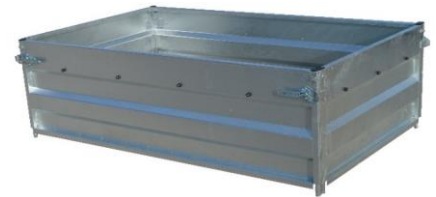
Aufsatzwandgarnitur 600 mm hoch geeignet für Geschweißte Ausführung siehe Seite 34