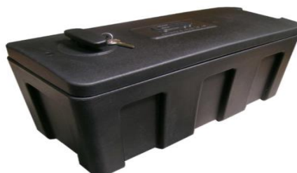
Werkzeugbox Modell A für Deichselmontage 60x60mm