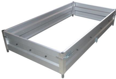
Aufsatzwandgarnitur 350 mm hoch geeignet für Leichte & Verstärkte Ausführung siehe Seite 34