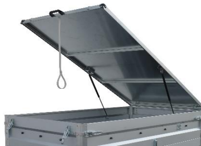
Deckel aus verzinktem Stahlblech vorne angeschlagen geeignet für die Leichte, Verstärkte und Geschweißte Ausführung siehe Seite 36