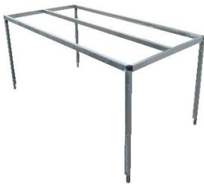
Hochplanenspiegel geeignet für Leichte & Verstärkte Ausführung siehe Seite 35