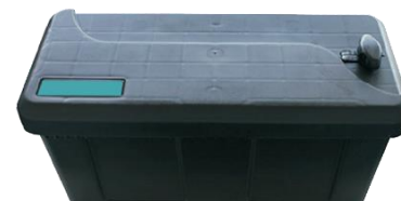
Werkzeugbox Modell K für Montage an der Bordwand