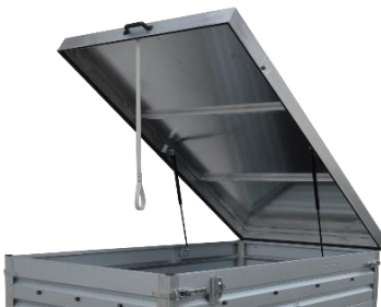
Aludeckel vorne angeschlagen geeignet für die Verstärkte und Geschweißte Ausführung siehe Seite 36